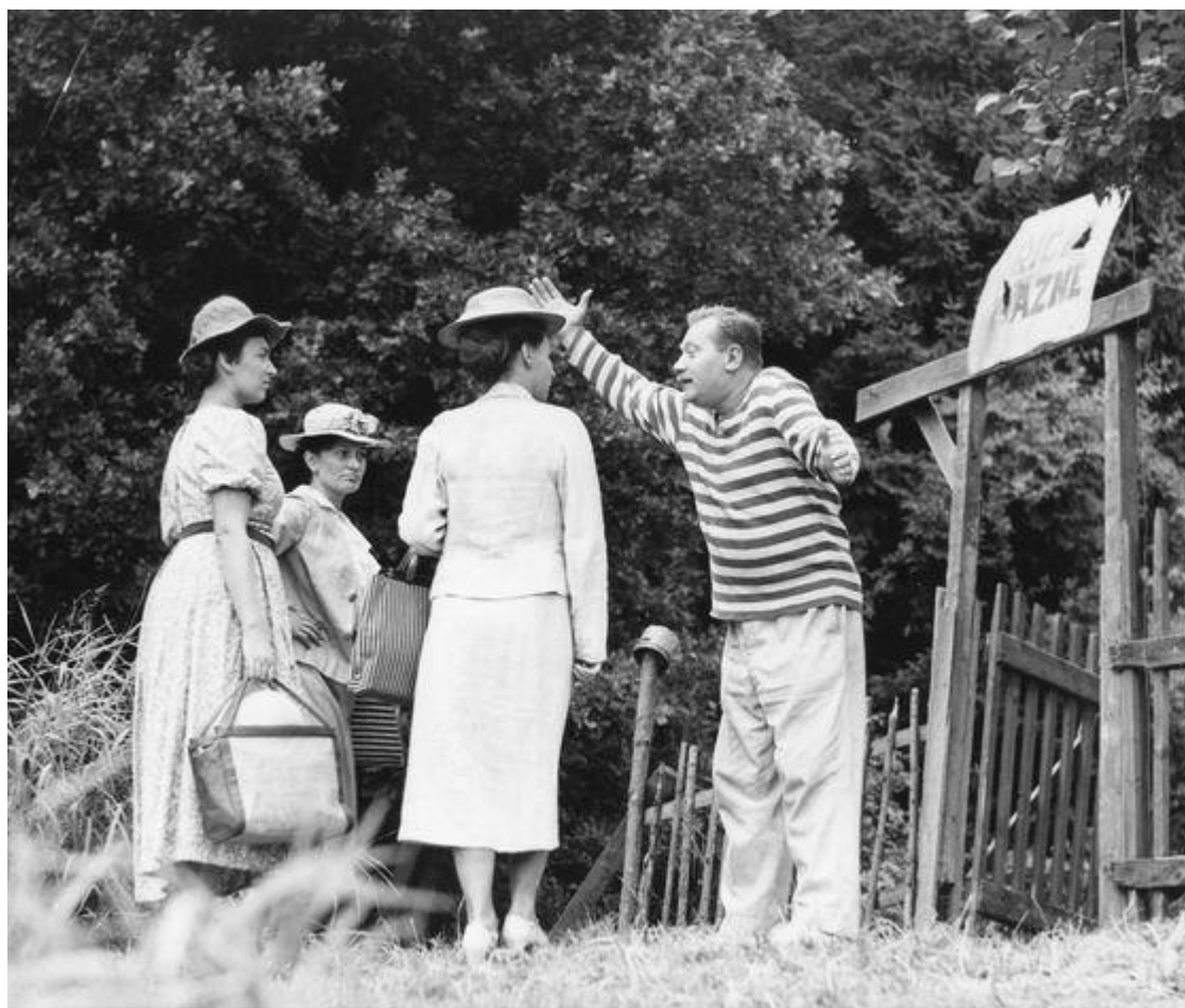
Rudolf Hrušínský v Rozmarném létu, 1967.

Dnes si výjimečné herectví Rudolfa Hrušínského, jeho postavy s kamennou tváří a lapidárním humorem, úsporné v gestech a bohaté vnitřním životem, připomínáme hlavně ve filmech. Některé z let padesátých a šedesátých se promítají dodnes: Cirkus bude! , Dobry voják Švejk , pohádka Dařbuján a Pandrhola , Menzelovo Rozmarné léto či Zločin v šantánu , Herzův Spalovač mrtvol .